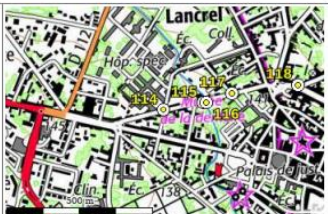
Carte : 1716 ALENCON