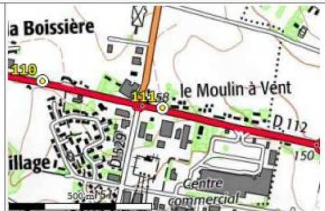
Carte : 1716 ALENCON